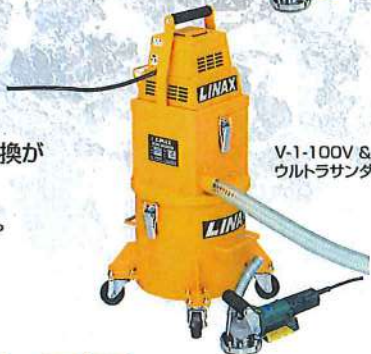
V-1-100V & ウルトラサンダー