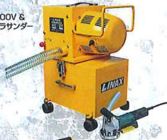
L-1-100V & ウルトラサンダー